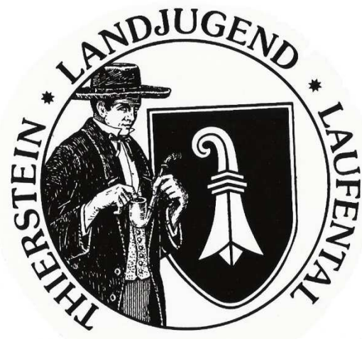
Landjugend Thierstein – Laufental