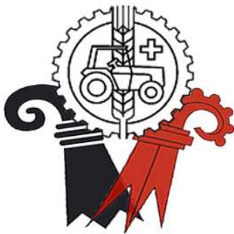
Verband für Landtechnik beider Basel und Umgebung VLBB